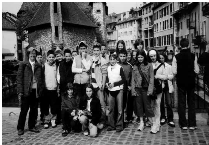
Un gruppo di ragazzi delle medie a Strasburgo

Si è risposto sempre positivamente alle necessità di assistenza alle autonomie, in modo da permettere al bambino portatore di handicap, di essere meglio seguito, ponendo attenzione alla scelta delle